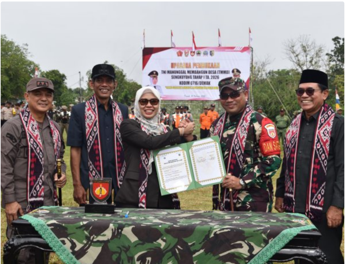
Upacara Pembukaan Tentara Manunggal Membangun Desa (TMMD) Sengkuyung Tahap I TA 2026

DEMAK - Kodim 0716/Demak gelar Upacara Pembukaan Tentara Manunggal Membangun Desa (TMMD) Sengkuyung Tahap I TA 2026. Bertindak sebagai