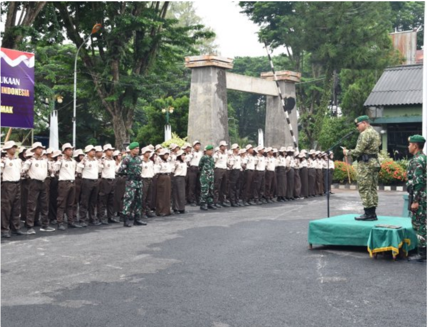
Dandim Demak Resmi Buka Gelaran Korps Kadet Republik Indonesia (KKRI) Di Wilayah Demak

DEMAK – Kodim 0716/Demak secara resmi membuka kegiatan Korps Kadet Republik Indonesia (KKRI) Gelombang IV Tahun 2026 melalui upacara yang khidmat digelar di Lapangan upacara Makodim 0716/Demak Jl. Kiyai singkil No.1