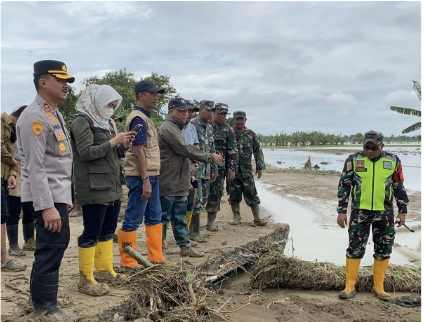
Dandim 0716/Demak Bersama Forkopimda Meninjau Tanggul Sungai Tuntang Demak Yang Jebol

Demak - Tanggul Sungai Tuntang Demak yang jebol di Dukuh Wareng, Desa Kebonagung, Kecamatan Kebonagung mulai ditangani secara darurat dengan